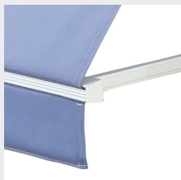
Utvändig manövrering med dragband av polyester.